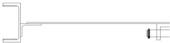
Рисунок 2. Исходная конструкция площадки

лучено, что напряжения возникаемые в месте крепления ролика не превышают более 60 МПа при допускаемых 140 МПа, а так же перемещения края яруса составляют 23 мм при допустимых по правилам безопасности 10 мм. При этом масса исходящей конструкции составляет 274 кг, следовательно, целесообразно изменить металлоконструкцию для увеличения ее жесткости за счет упрощения конструктивной схемы (рисунок 4).